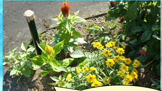
学生さんから頂いた苗に綺麗な花が咲きました。