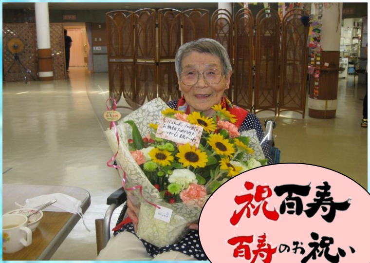
祝百寿 百寿のお祝い