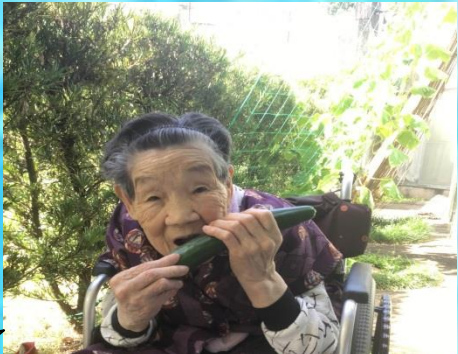
施設の畑で育てた野菜を収穫しました。